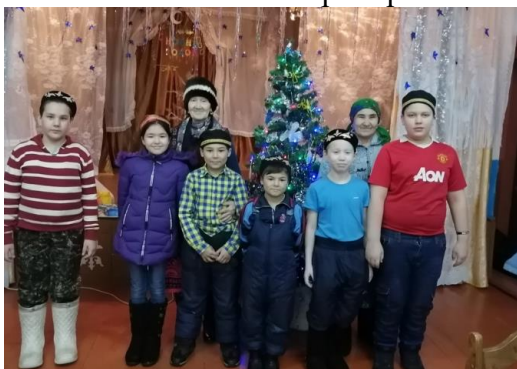
Рис.5 В гостях у жителей д.Ирек