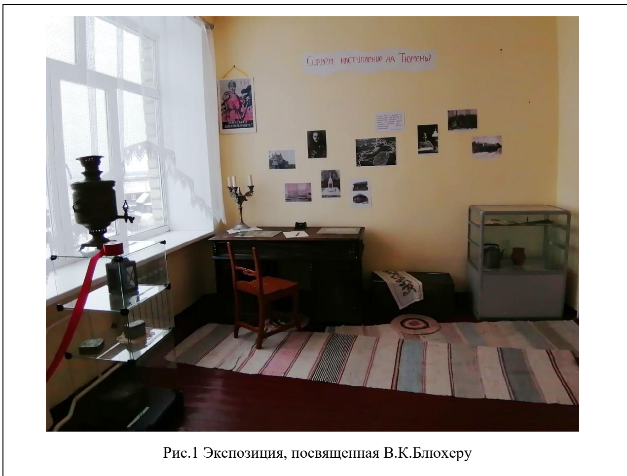
Рис.1 Экспозиция, посвященная В.К.Блохеру