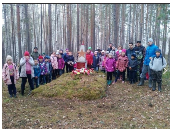
Рис.2 Поход на Коммунистическую гриву октябрь 2020 г.