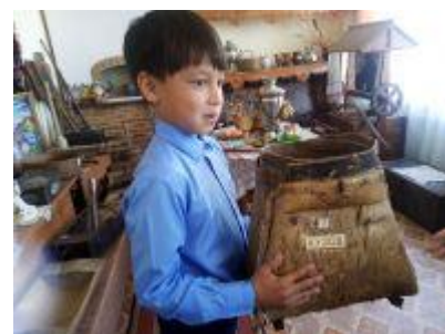
Рис. 3-5 Урок русского языка «Язык и человек»