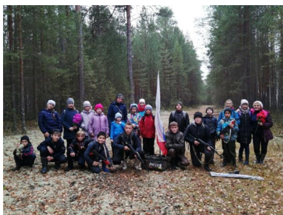
Рис.1 Поход на Коммунистическую гриву октябрь 2019 г.