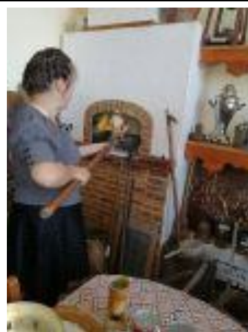
Рис. 1-2 Урок литературного чтения «Бытовая сказка»