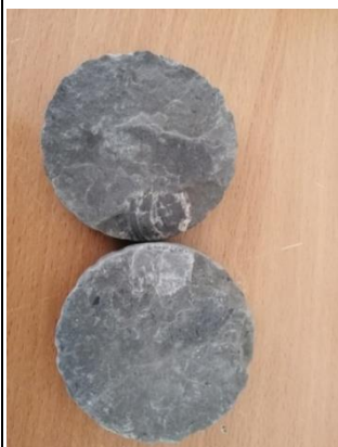
Рис. 7 Керны, извлеченные из глубины 3тыс. м., с изображением ракушки