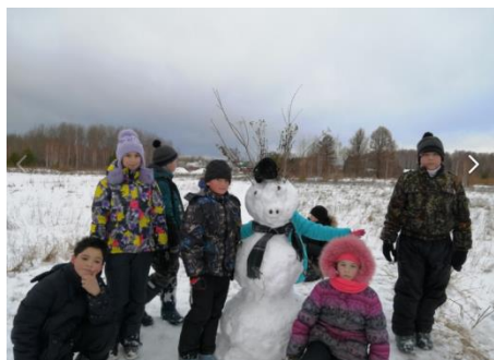
Рис.3 Поход-экскурсия на место, где когда- то был аэропорт