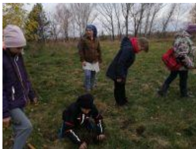
Рис. 7-8 Экспедиция по следам боев дивизии В.К.Блюхера в окрестностях села Байкалова