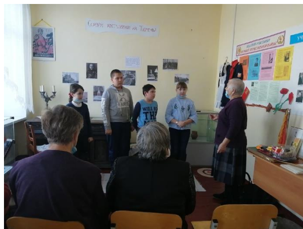
Рис. 4 Экскурсия для ветеранов