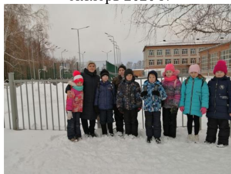
Рис. 4 Идем на экскурсию