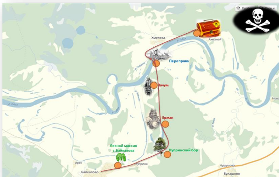
Рис.1 Карта маршрута игры «Сокровища хана Кучума»