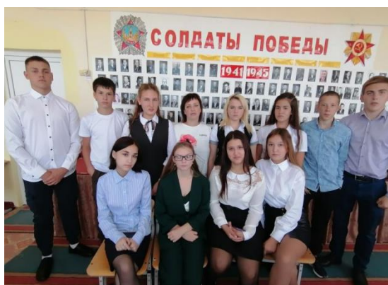
Рис. 6 Урок мужества "Помнить - значит знать"